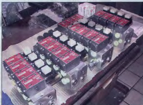
In Bakede produziert: Hydrauliksteuerblöcke für Kehrfahrzeuge.

eine Klage wegen Vertragsbruch sieht Ruppel als aussichtslos an, obwohl ihm sein Know-how gestohlen wurde.